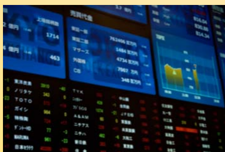
※2011年版 注目の経済動向セミナー