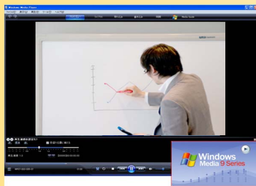
※動画再生イメージ