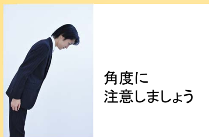
※面接での注意点セミナー